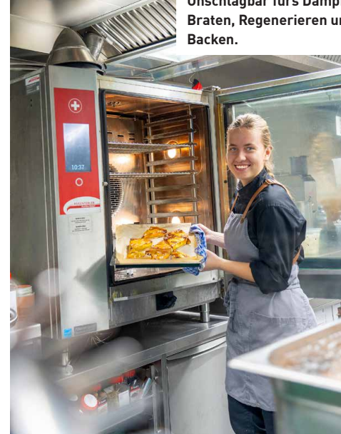
Practico Vision Plus: Unschlagbar fürs Dämpfen, Braten, Regenerieren und Backen.