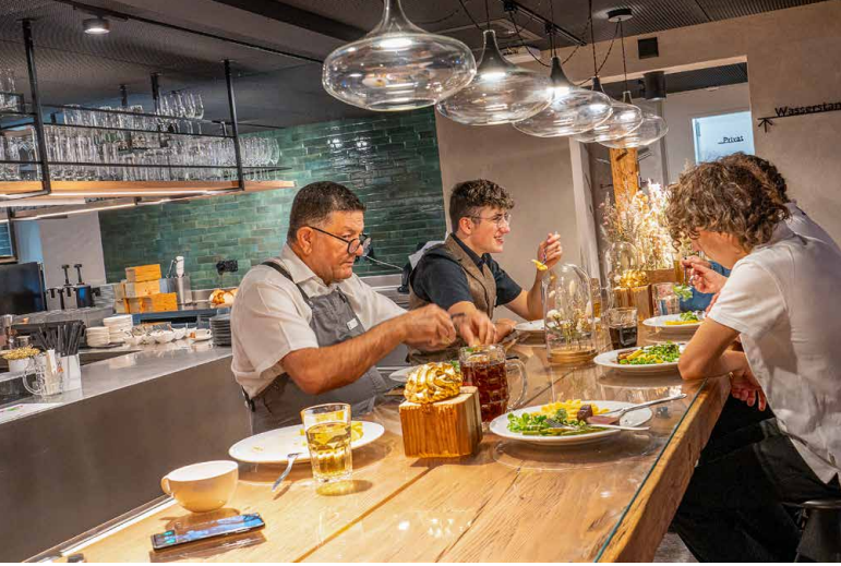
Teamspirit à la Kemmeriboden Bad #1. Hier wird gelacht, gemeinsam im Restaurant gegessen und angepackt.