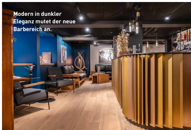
Modern in dunkler Eleganz mutet der neue Barbereich an.