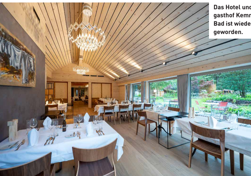
Das Hotel und Landgasthof Kemmeriboden Bad ist wieder ein Bijou geworden.

4. Juli 2023. Auf den Tag genau feiert das Hotel und Landgasthof Kemmeriboden Bad nach einem Jahr des Wiederaufbaus Eröffnung. An den schicksalhaften Tag erinnert auch der Unwettertisch im Restaurant, ein grosser Holztisch aus ehemaligen Bodendielen, der auf einem angeschwemmten Felsbrocken abgestützt ist. Ansonsten ist alles rundum erneuert worden. Die Sitzbänke aus Emmentaler Eiche im Restaurant genauso wie der begehbare Weinschrank, die ganze Küche und der stimmige Empfangsbereich des Hotels.