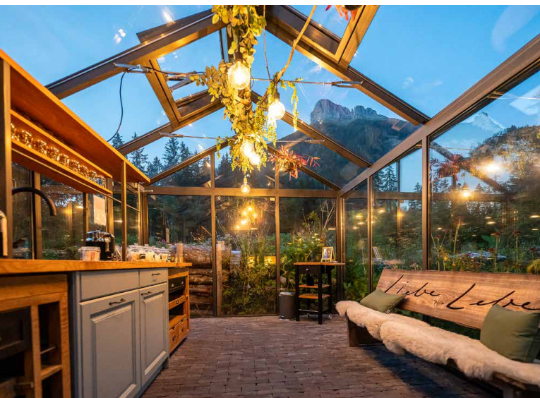
Neu entstanden für Hotelgäste: Das Teehaus inmitten des schönen Bauerngartens. Hier kann man sich nach dem Saunagang gut entspannen.

Reto Invernizzi, Gastgeber im Hotel Landgasthof Kemmeriboden Bad.