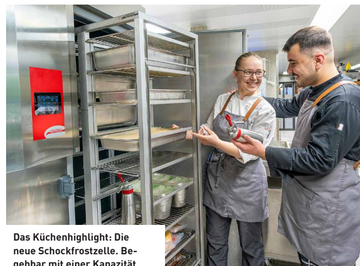
Das Küchenhighlight: Die neue Schockfrostzelle. Begehbar mit einer Kapazität, die der erwarteten Verpflegungsfrequenz entspricht.