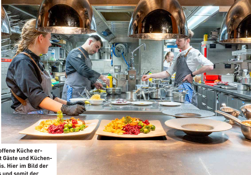
Die offene Küche erfreut Gäste und Küchenprofis. Hier im Bild der Pass und somit der Knotenpunkt zwischen Gästen, Service und Küche.