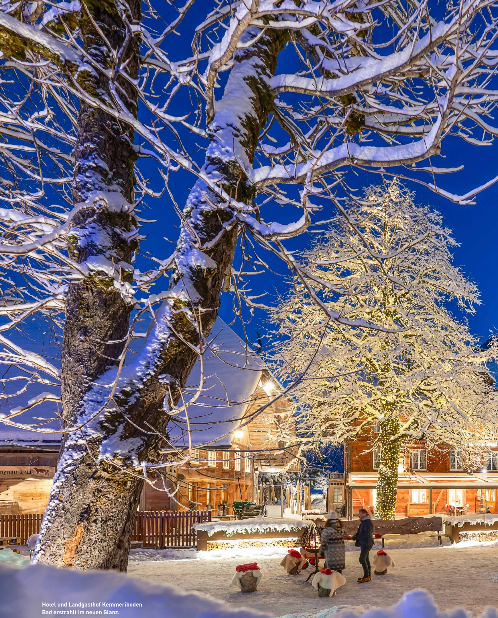
Hotel und Landgasthof Kemmeriboden Bad erstrahlt im neuen Glanz.