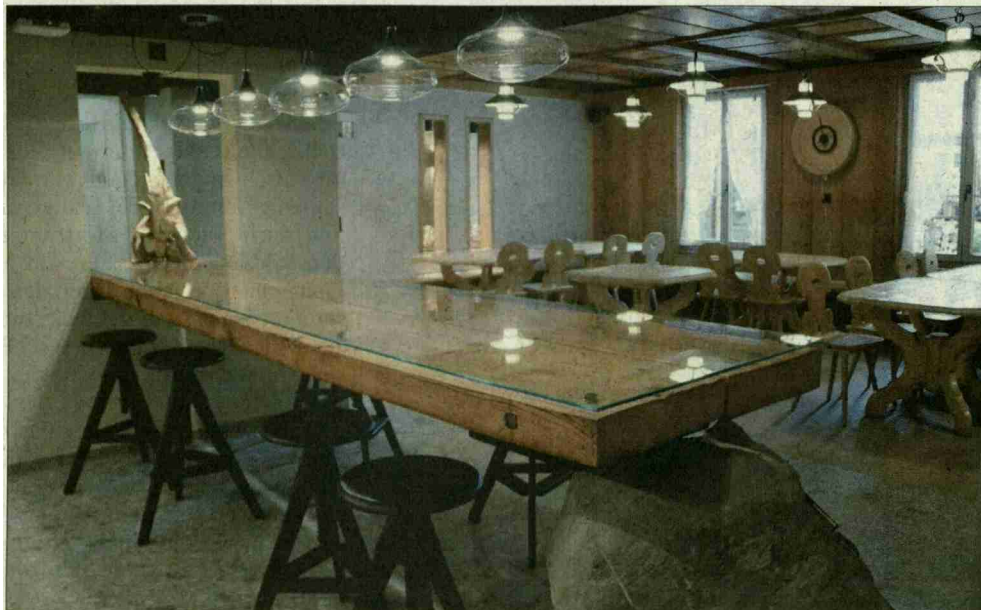
Der «Unwetter-tisch» in der Gaststube entstand aus alten Balken und einem angeschwemmten Stein.