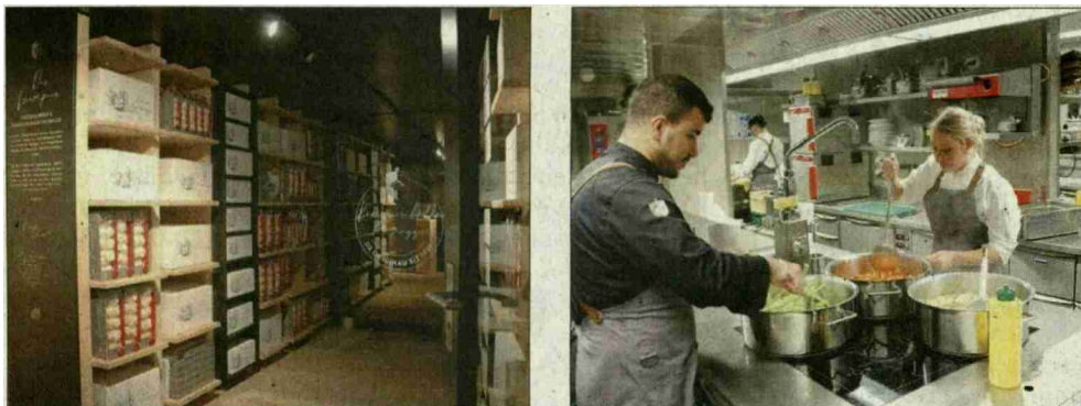
Der «Meränge-Tresor» (links) und die Küche, die bereits in Betrieb ist.